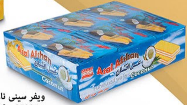
ویفر سینی نارگیلی Code: 05094