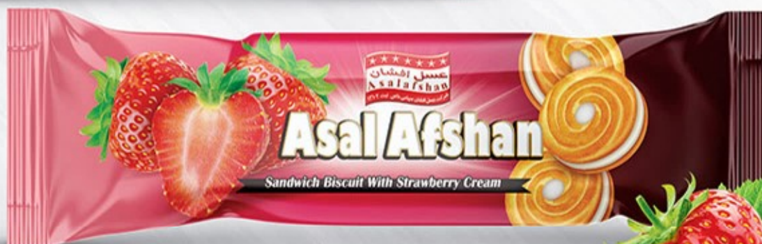
کرمدار شش عددی توت فرنگی Code: 03250