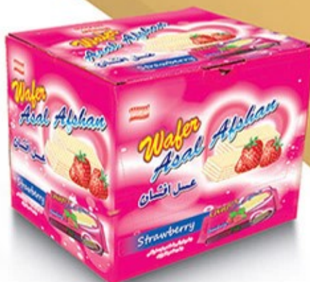
ویفر بالشتی جعبه ای توت فرنگی Code: 05117