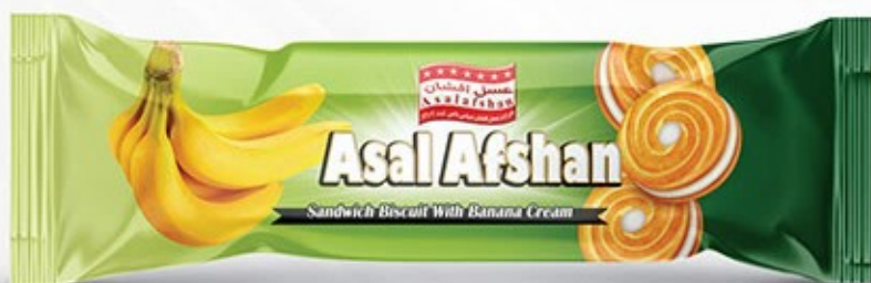
کرمدار شش عددی موزی Code: 03274