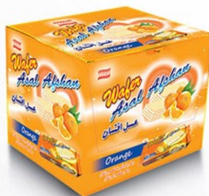
ویفر بالشتی جعبه ای پرتغالی Code: 05124