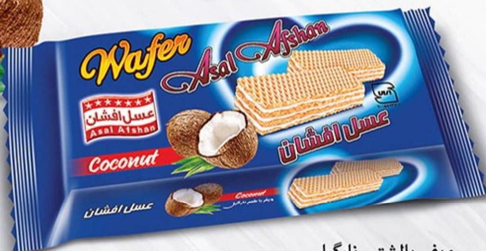
ویفر بالشتی نارگیلی Code: 02116