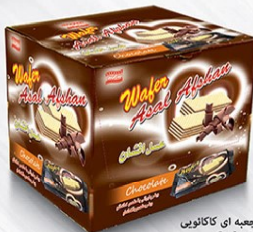
ویفر بالشتی جعبه ای کاکائویی Code: 05155