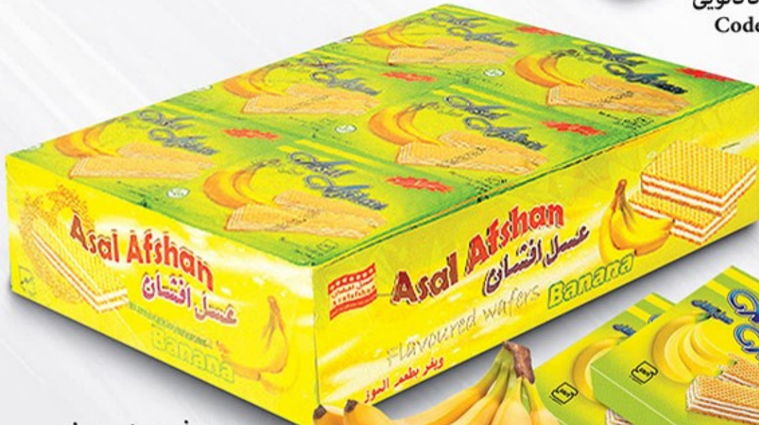
ویفر سینی موزی Code: 05087