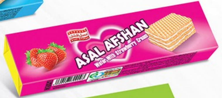
ویفر مانژ توت فرنگی Code: 02093