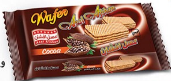
ویفر بالشتی کاکائویی Code: 02154