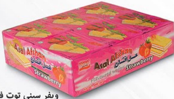
ویفر سینی توت فرنگی Code: 05063