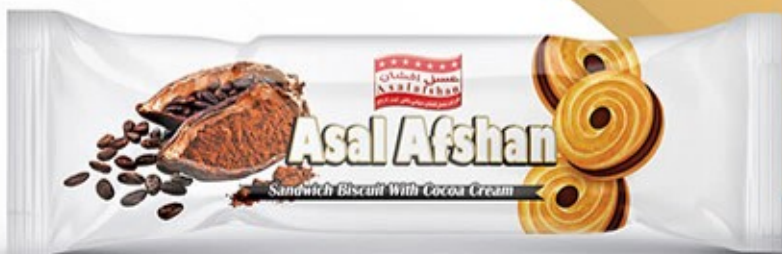
کرمدار شش عددی کاکائویی Code: 03267