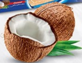
ویفر بالشتی جعبه ای نارگیلی Code: 05148