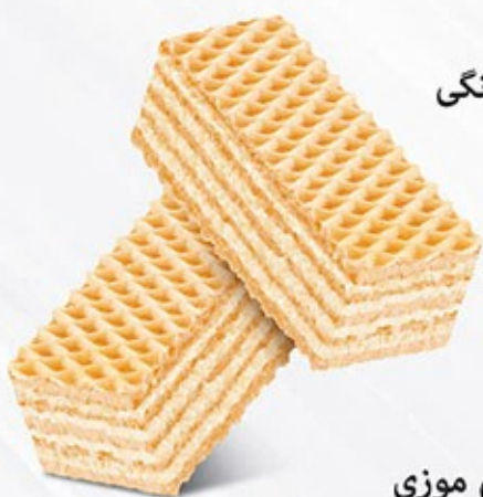
ویفر بالشتی توت فرنگی Code: 02123