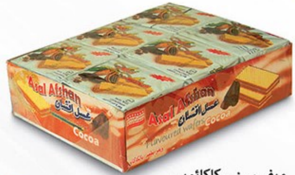
ویفر سینی کاکائویی Code: 05100