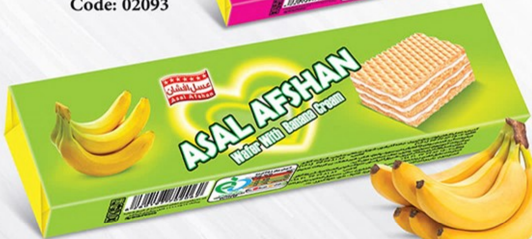
ویفر مانژ موزی Code: 02062