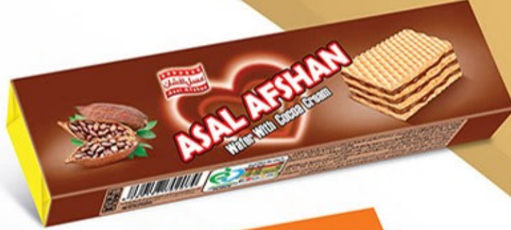
ویفر مانژ کاکائویی Code: 02079