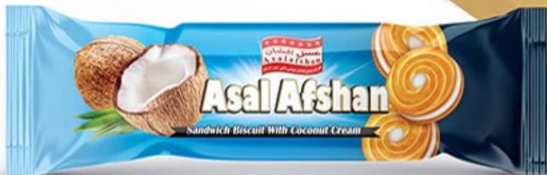
کرمدار شش عددی نارگیلی Code: 03281