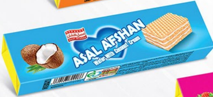
ویفر مانژ نارگیلی Code: 02086