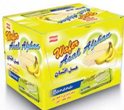
ویفر بالشتی جعبه ای موزی Code: 05131