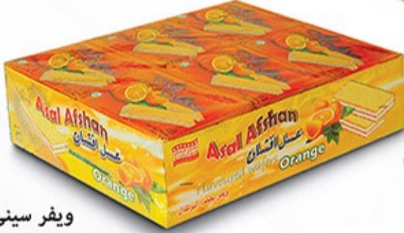
ویفر سینی پرتقالی Code: 05070