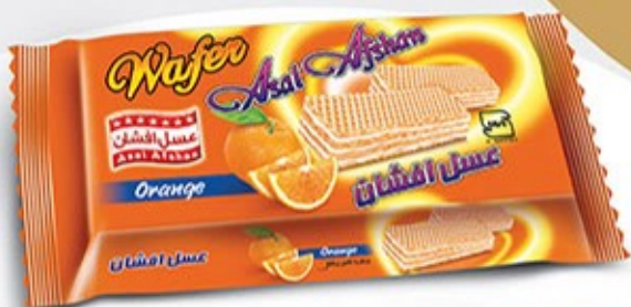
ویفر بالشتی پرتقالی Code: 02147