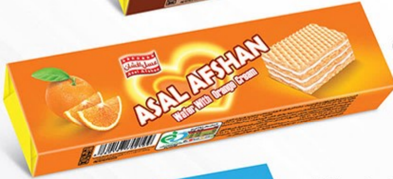
ویفر مانژ پرتقالی Code: 02109