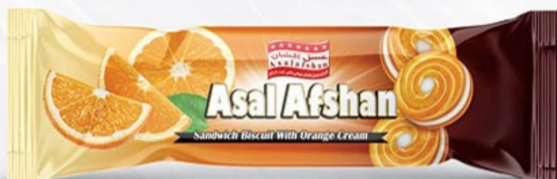
کرمدار شش عددی پرتقالی Code: 03243